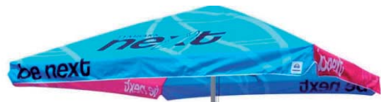
Digitaalisesti tulostettu mainosvarjo